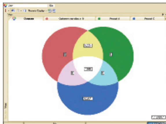
U kunt de resultaten ook bekijken in een vendiagram, compleet met segmenttelling om snel de mogelijkheden tot cross-sell te identificeren.